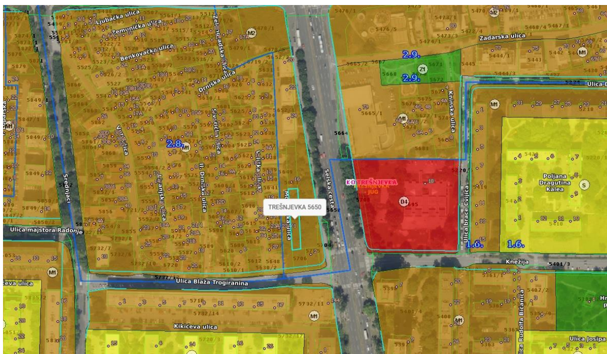
PREMA KARTOGRAFSKOM PRIKAZU „KORIŠTENJE I NAMJENA PROSTORA“ I „URBANA PRAVILA“ PREMA GUP-u